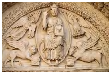
Portail de l'église St Trophime d'Arles

Les 5 - 12 et 19 novembre 2014 Les 20 - 27 mai et le 3 juin 2015