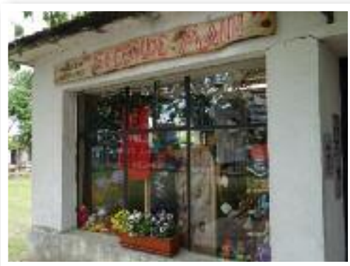
Le magasin d'Avotra Alsace