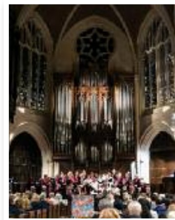
Concert à l'Église américaine, le 18 mars 2022

Grâce aux bénévoles, et aux nombreux clients, le magasin solidaire a déjà pu envoyer en un an 14 000 € via La Cause pour l'accueil et l'accompagnement de ces orphelins de Madagascar.