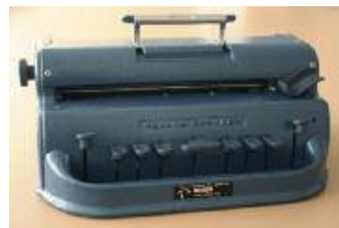
Machine à écrire en braille Perkins

On pouvait compléter l'équipement avec une machine à écrire en braille, les plus connues étant de la marque Perkins. L'invention de la machine à écrire est historiquement liée à la déficience visuelle et procède du besoin de communication écrite entre voyants et non-voyants. On date de